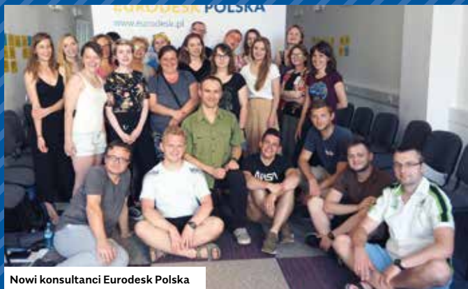
Nowi konsultanci Eurodesk Polska

Przez trzy upalne czerwcowe dni gościliśmy w Warszawie nowych konsultantów Eurodesk Polska. Mapa naszej sieci powiększyła się o kolejne miasta: Kalisz, Kostrzyn nad Odrą, Kolin, Kołobrzeg i Dąbrowę Górniczą. Szkolenie obejmowało m.in. poznanie historii, struktury, narzędzi Eurodesku oraz eurodeskowego know-how związanego z udzielaniem informacji, promocją i public relations. W programie znalazło się też jednodniowe szkolenie z programu Erasmus+. A co było najważniejsze dla uczestników? Ewaluacja (anonimowa) nie pozostawia wątpliwości: poznanie nowych inspirujących osób z organizacji i instytucji z całej Polski. Pojawiły się już pierwsze wspólne pomysły! Tak właśnie działa Eurodesk.