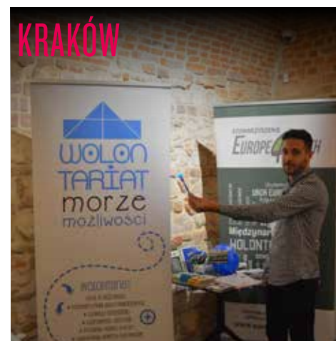
Dzień Informacji o Mobilnościach Edukacyjnych dla Młodzieży