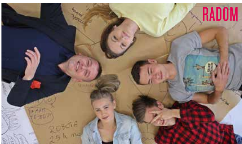
Młodzież chce mieć wpływ na swoją przyszłość, dlatego informacja o możliwościach rozwoju jest dla niej ważna

nie Centrum Młodzieży „Arka”), wymiany młodzieżowe (Stowarzyszenie ANA-WOJ) oraz konferencje na temat mobilności (Stowarzyszenie Europe4Youth). W tym roku odbyły się nawet warsztaty kulinarne oraz karaoke, zorganizowane przez zagranicznych wolontariuszy,