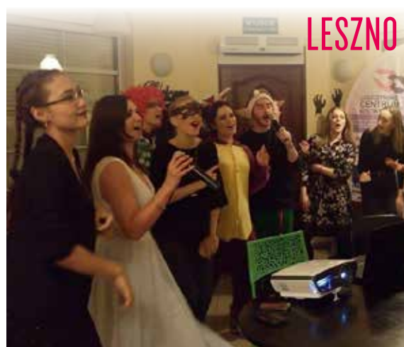
Rozśpiewani wolontariusze podczas karaoke w Lesznie