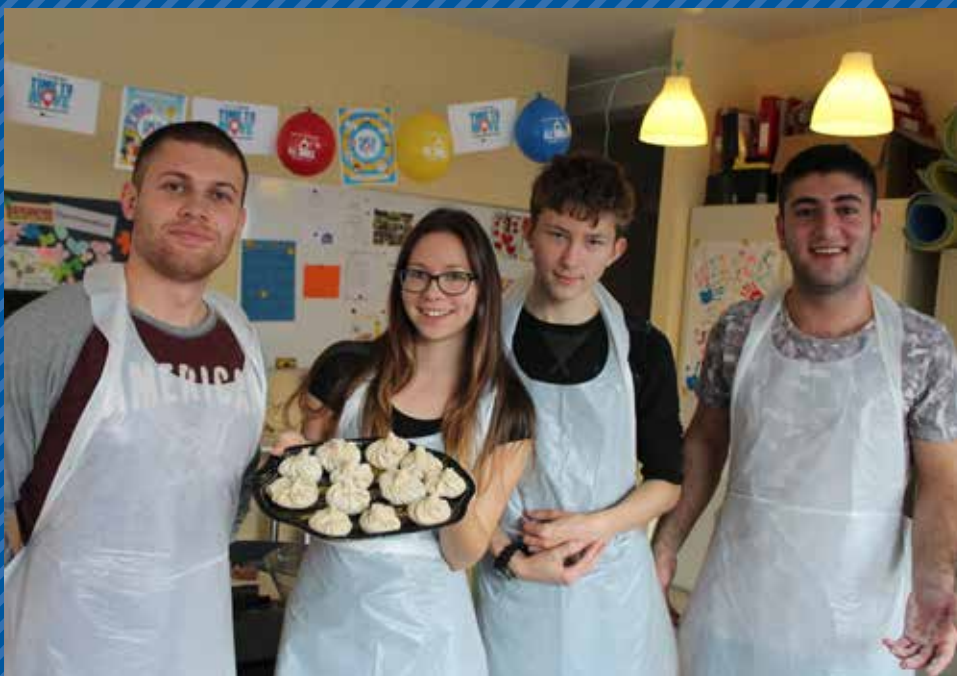
nie samą informacją żyje człowiek – podczas Time to Move w Lesznie mieszkańcy mogli spróbować tradycyjnych potraw

Polska drugi rok z rzędu uplasowała się na pierwszym miejscu pod względem liczby wydarzeń. Multiplikatorzy polskiej sieci zorganizowali 119 spotkań z młodzieżą, eurolekcji, warsztatów, seminariów, spotkań informacyjnych oraz konkursów i kampanii online. Dzięki ich codziennej pracy ponad 90 tys. osób