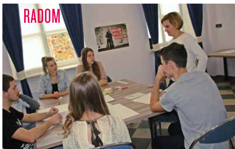
Młodzież podczas warsztatów nt. aktywności