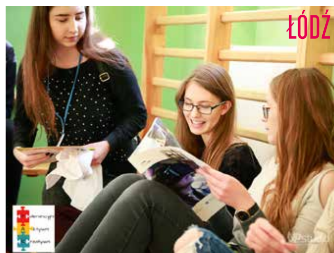
Uczestniczki projektu TAK - Tolerancyjni, Aktywni, Kreatywni