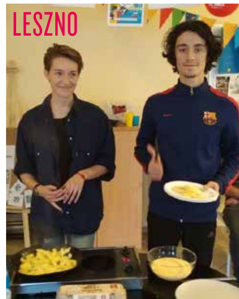
Warsztaty kulinarne ze specjalami kuchni hiszpańskiej

świetna okazja do pokazania, że mobilność europejska nie dotyczy tylko młodzieży z Paryża czy Madrytu, a może stać się udziałem każdego. To, czy młody człowiek ma szansę z niej skorzystać, zależy od informacji otrzymanej w odpowiednim czasie”. Za rok kolejna edycja – zapraszamy!