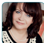
PROF. DR HAB. BARBARA KUDRYCKA

Wysoko oceniam współpracę z FRSE w zakresie wdrażania i promocji programów stypendialnych wspieranych z funduszy norweskich i szwajcarskich. Profesjonalne podejście Fundacji do beneficjentów jest również niewątpliwym sukcesem programów.